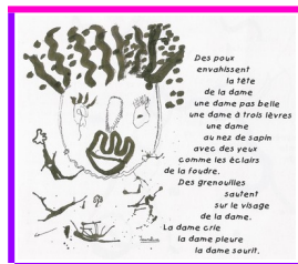
Poésie et dessin