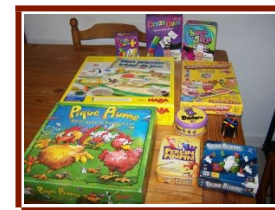
Jeux de société