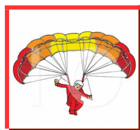
Le parapente, qu'est ce que c'est ?