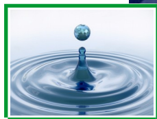
Sur les traces d'une goutte d'eau