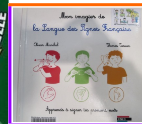
Langue des signes